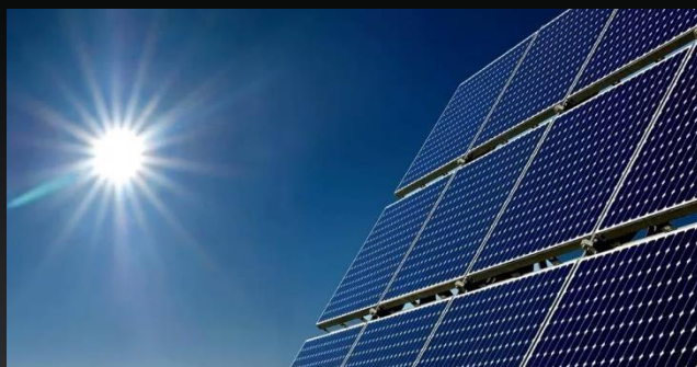
Panel Solar: 645 W Cantidad: 232