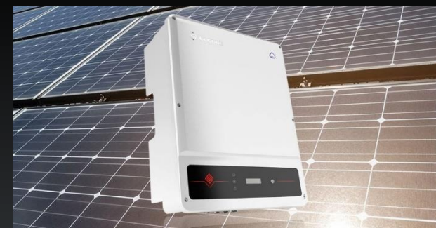
Inversor Onda pura Cantidad: 1